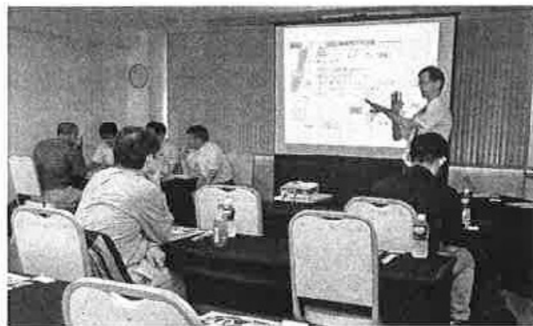
都市部での医師募集説明会を開催