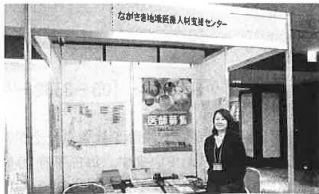
学会にて医師募集をPR