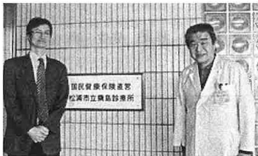
地域の情報収集や意見交換により実情を把握

これまで56人の医師を斡旋するなど、地道な努力の積み重ねとその成果が、他の都道府県の模範となる取組として認められたもので、今後とも活躍が期待されている。